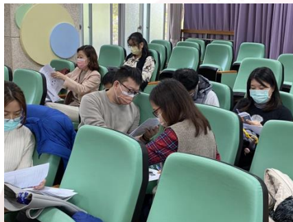
教學顧問現場授課