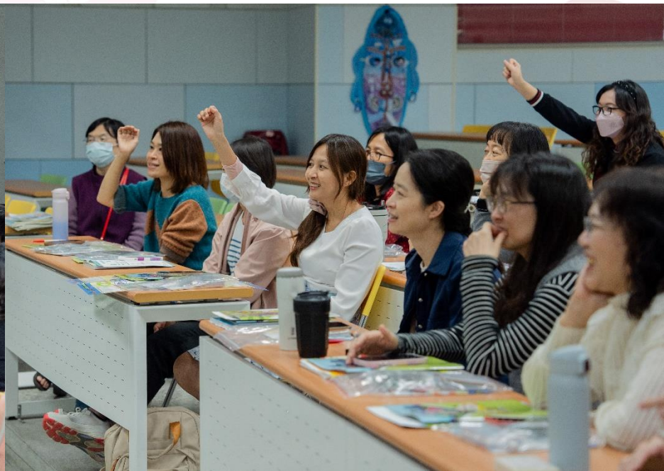
教師研習暨工作坊 (由專業師資入校授課，包含課程教材)