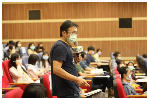
教學顧問現場授課