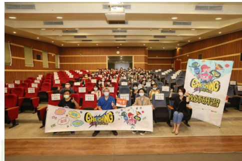
新北板橋國小教師大合照