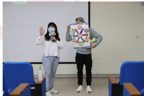
講解桌遊使用方式