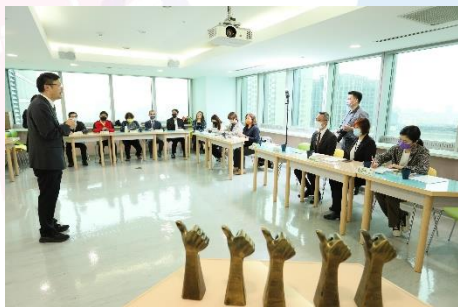
金牌學校認證儀式