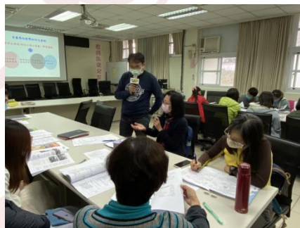
教師針對教案進行分享