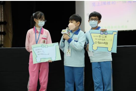
學生上台報告討論內容