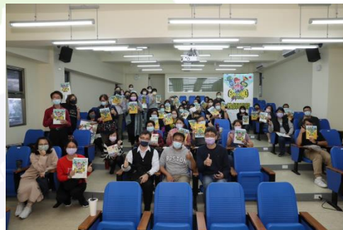
基隆仁愛國小教師大合照