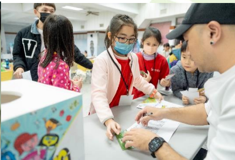
學生於捐獻站捐出款項