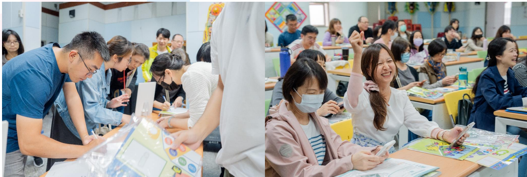
教學分享會暨工作坊花絮：小組討論及教案實作