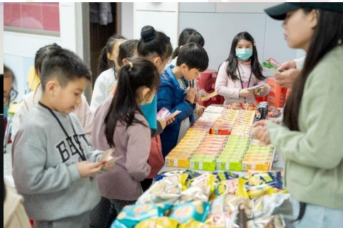
學生於CHA-CHING柑仔店購買商品