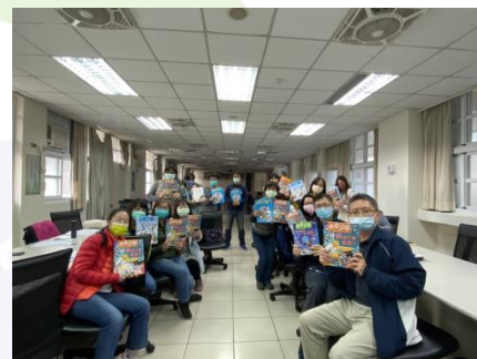
基隆建德國小教師大合照