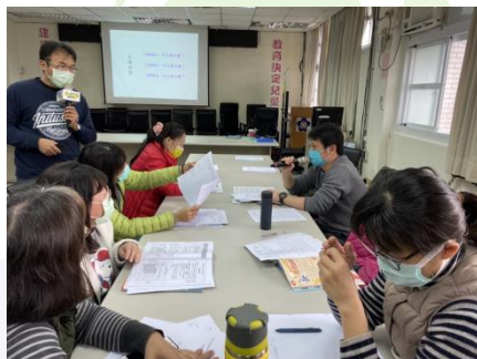
教師現場交流分享