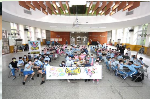
基隆仁愛國小大合照