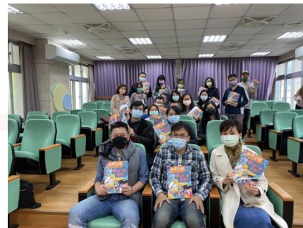
新北板橋國小教師大合照