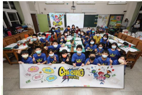
新北板橋國小大合照