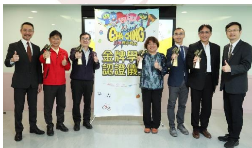
金牌學校認證儀式 大合照