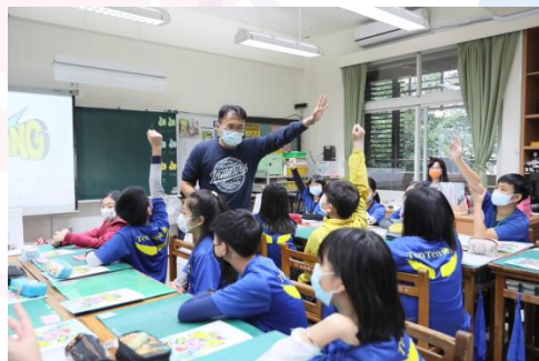
教學顧問現場授課

實際進入種子學校校園，透過「情境式教學」現場授課、觀看MV、理財桌遊、CHA-CHING柑仔店、捐獻站等教學方式，教學過程中培養孩子理財素養新思維。