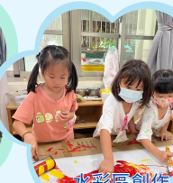
水彩區創作 體會混色的美