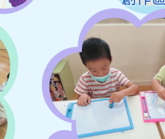
語文區練習運筆及仿畫