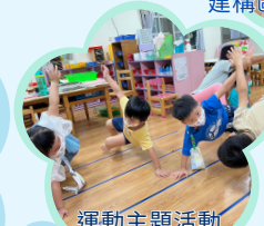
運動主題活動 身體變變變