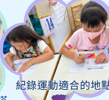
紀錄運動適合的地點