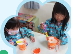
萬聖節慶活動 製作可愛的南瓜杯