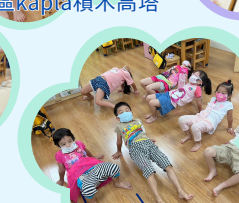
運動主題活動 身體動一動